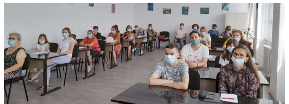
Școala Gimnazială Spiru Haret Dorohoi