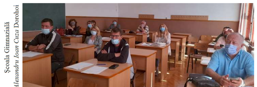
Școala Gimnazială Alexandru Ioan Cuza Dorohoi